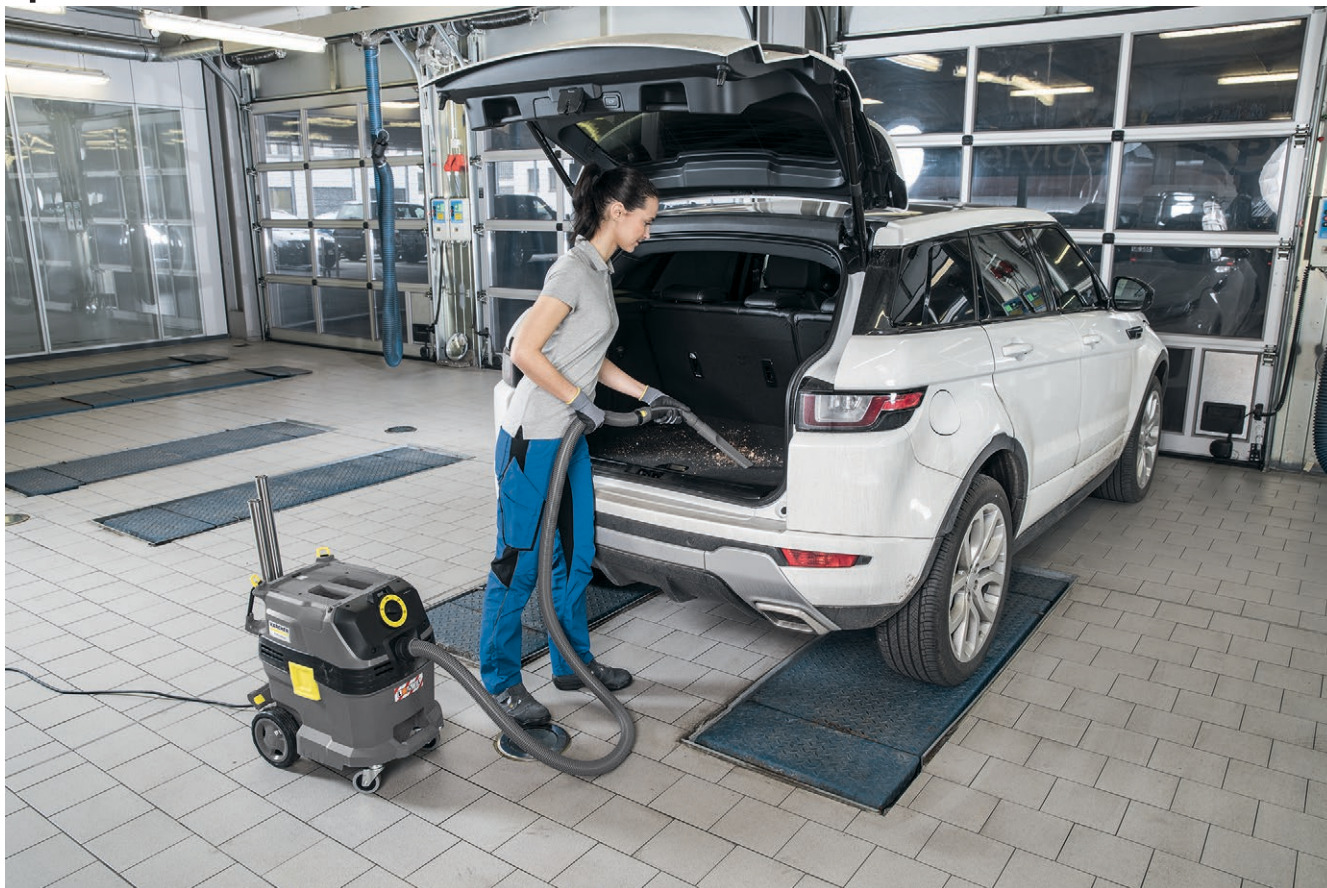
NT 30/1 Tact L